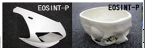
樹脂試作部品 医療サンプルモデル